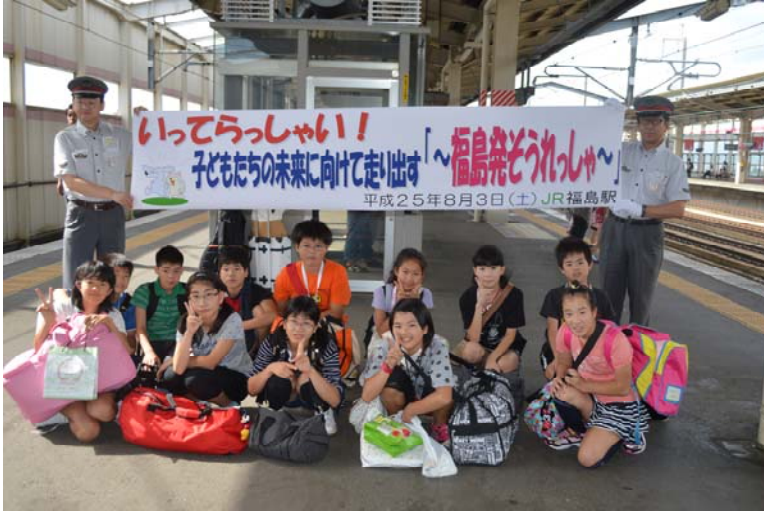
2013年8月ぞうれっしゃ修学旅行に来名した福島市立下川崎小学校6年生と横断幕を作って見送ってくれたJR福島駅の職員

福島からも来年、愛知へ行けないかと検討中です。去年お世話になった現中学1年生13人、来年6年生になる子どもたち18人に提案をしています。来年中学2年生になる子どもたちは、学校や部活の兼合いがあり、また来年6年生になる子どもたちも来年度の学校体制が決まらない中での提案のため、すべてが未知数ですが、戦後70年の節目に再び『福島発ぞうれっしゃ』が実現することを願って活動していきたいと思っています。このプロジェクトの成功に少しでも力になれば幸いです。日本は再び戦争への道を選択しているように感じられます。しかし、それは子どもたちのためにも阻止しなければいけないと強く感じます。私たち一人一人の力は小さいけれど、多くの人が集まり、大きなうたごえを届けることで、この不穏な世の中に一石を投げられればと思います。